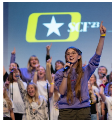
Soul Children-festivalen i Örebro var en av höstens höjdpunkter.