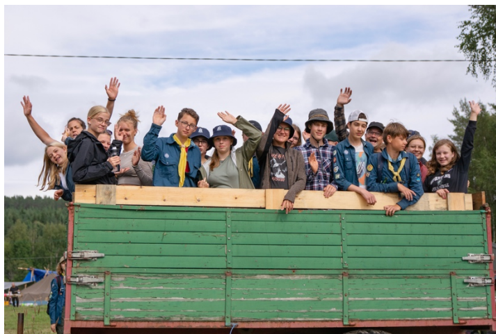
Tonårsbyn Råoute på Patrullriks i Mjösjöleden.

Arbetet med att hitta lägerplats för Patrullriks 2026 har fortsatt under året tillsammans med Salts och EFS ledningsgrupper.