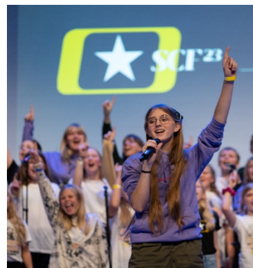
Soul Children-festivalen i Örebro var en av höstens höjdpunkter.